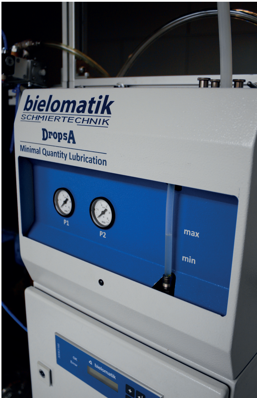
Bild 1: Das neue 1-Kanal MMS-System von Bielomatik, ausgelegt für einen Eingangsdruck bis 25 bar

Tiefbohröl mit HP-Additiven, KSS-Druck von bis zu 160 oder gar 200 bar bei Kleinstdurchmessern sowie eine leistungsfähige Filtrierung.