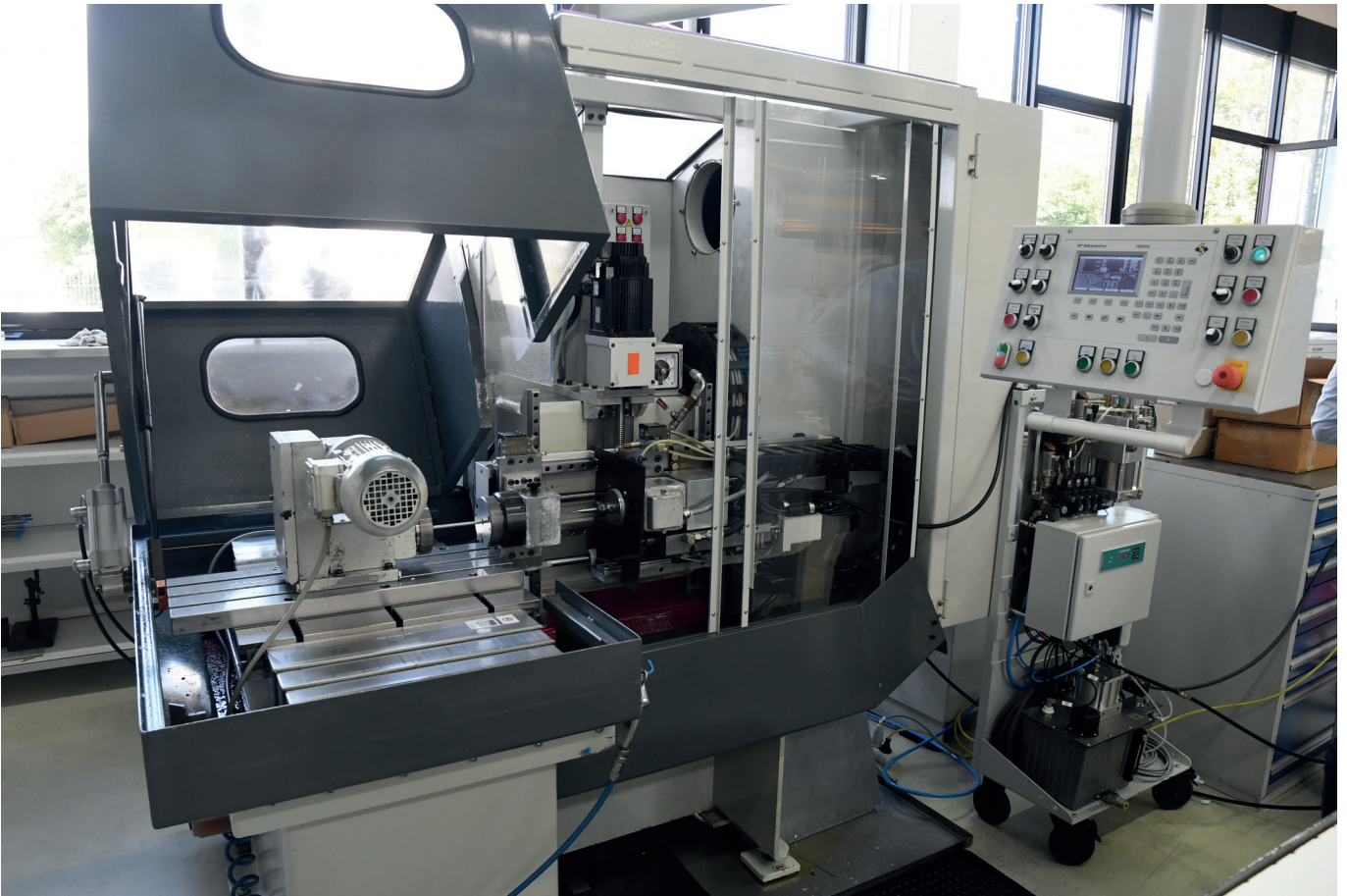
Bild 4: Tiefbohren von nichtrostendem Stahl auf einem Tiefbohrzentrum TBS200

mit Durchmesser 1,5 mm einzubringen. Die geforderten Qualitätskriterien: Ein Ra-Wert von 0,2 µm sowie ein Mittenverlauf unter 0,03 mm. Mit der Erzeugung deutlich kürzerer